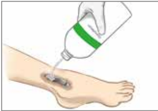
1A. Sorgfältige Wundspülung mit Granudacyn-Wundspüllösung.

Wundspüllösung und -spray: zur Reinigung und zur präzisen Verabreichung und Dosierung.