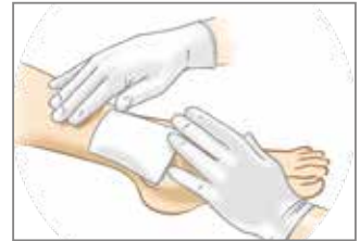
2. Geeignet zur Kombination mit Standard-Wundauflagen.

Granudacyn® kann zur Instillation mit NPWT (Unterdruck-Wundtherapie) verwendet werden.