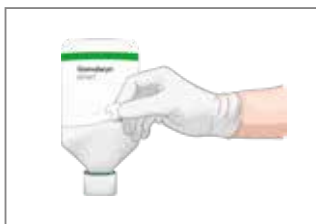
2. Lösen Sie den Tragegriff vom Etikett und stechen Sie die Flasche an.