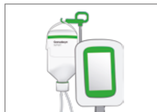
3. Hängen Sie die Flasche an den Tragegriff der Aufhängevorrichtung.