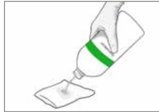
1C. Alternativ satt getränkte Komresse/n mit Granudacyn Wundspüllösung auf die Wunde auflegen und nach Bedarf einwirken lassen.