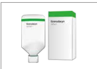
1. Nehmen Sie die NPWT-Flasche aus der Verpackung.

Granudacyn® kann zur Instillation mit NPWT (Unterdruck-Wundtherapie) verwendet werden.