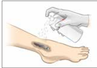
1B. Aus einer Entfernung von ca. 15-30 cm auf die gereinigte Wunde sprühen.