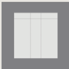
BNS 977050 Instrumentpose placeres iht. præference

Dette er et eksempel (BNS 956967) på en laparoskopiafdækning med mange egenskaber og fordele.