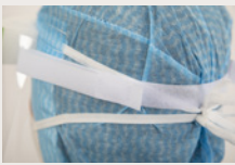
Säädettävät päähinnat parantavat istuvuutta

Kasvosuojat on suunniteltu suojaamaan käyttäjän silmiä ja kasvoja roiskeilta