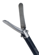
Pince de préhension bec de canard