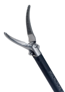
Pince à dissection de Maryland