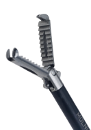
Pince de préhension à dents de rat