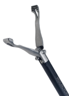
Pince de préhension Babcock