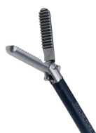
Pince de préhension droite