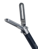
Pince de préhension droite – ajourée