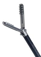
Pince de préhension Clinch