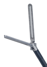
Pince de préhension intestinale