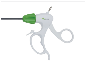
Poignée à usage unique