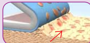
Traditionele kleeflaag trekt huidcellen mee.

Voor meer informatie bezoek www.safetac.com