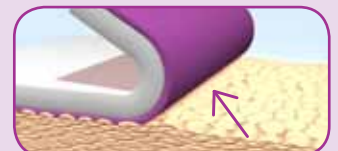
Safetac®-adhesielaag trekt geen huidcellen mee.